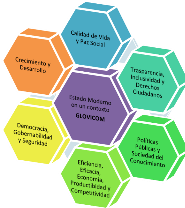
Figura 1.2: RENDICIÓN DE CUENTAS Y NUEVOS DESAFÍOS DEL ESTADO MODERNO EN UN CONTEXTO GLOVICOM