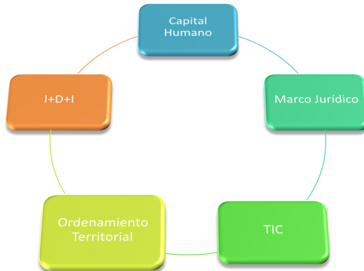
Figura N°1: FACTORES que promueven el fortalecimiento de las capacidades nacionales y locales para la gestión del desarrollo sostenible”